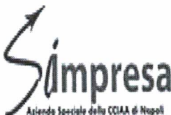
image003 . jpg