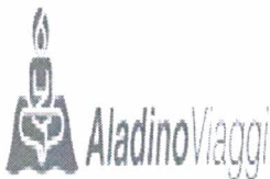
image001 . png